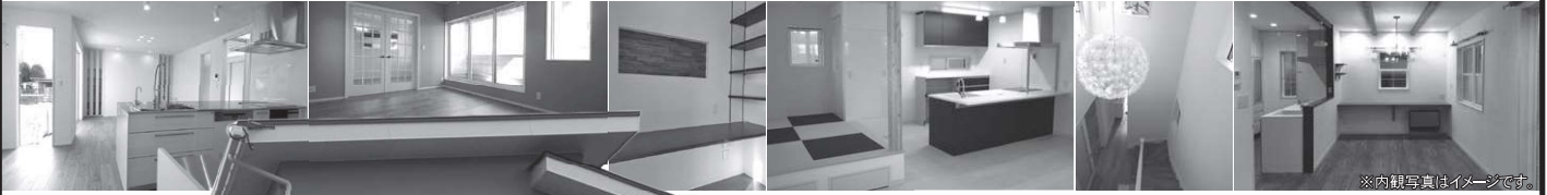
※内観写真はイメージです。

ご予約は松本ショールームまでお電話で (0263-29-5775)お申込みください。