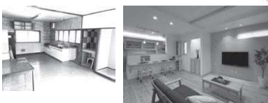
BEFORE → AFTER