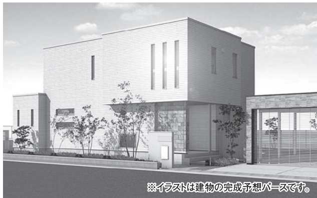
※イラストは建物の完成予想パースです。