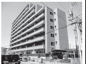
【物件写真撮影日】令和5年4月10日

リフォーム実施(令和5年4月末完了) ●クロス貼替え・CF貼替え・畳表替え ●ふすま張替え・ガス台新品交換・給湯器新品交換 ●照明玉交換・網戸張替え・全室クリーニング