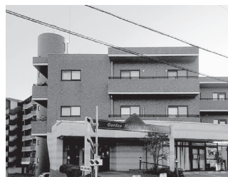
【物件写真撮影日】令和4年10月21日

リフォーム内容(2018年2月一部リフォーム済) ●給湯器新品交換・キッチン新品交換 ●トイレ新品交換・浴室新品交換 ●クロス張替(西側洋室以外) ●床フローリング張替(東側洋室2部屋のみ) ●CF張替(トイレ、洗面)・一部エコカラット使用