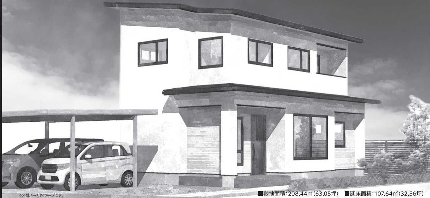
敷地面積:208.44㎡(63.05坪) ■延床面積:107.64㎡(32.56坪)