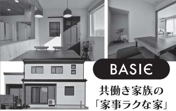
BASIE 共働き家族の「家事ラクな家」