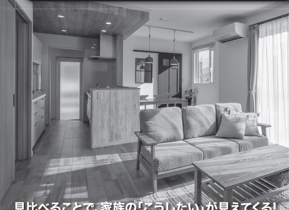
見比べることで、家族の「こうしたい」が見えてくる!

\ 相模組の「あったかい家」/ モデルハウス BASIE STYLE Fit 2棟同時見学会 1/13(土)・16(火) 予約優先 10:00-17:00