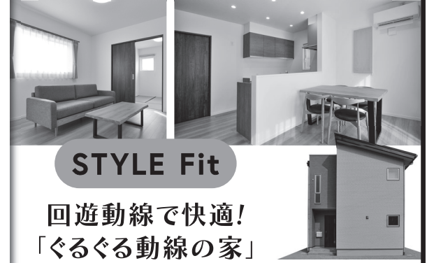
STYLE Fit 回遊動線で快適! 「ぐるぐる動線の家」