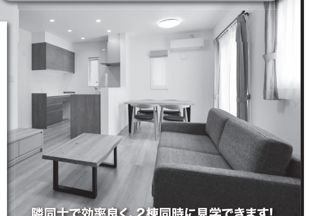
隣同士で効率良く、2棟同時に見学できます!

\ 相模組の「あったかい家」/ モデルハウス BASIE STYLE Fit 2棟同時見学会 1/13(土)・16(火) 予約優先 10:00-17:00