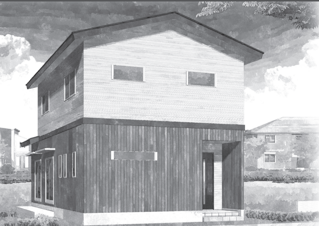
※外観パースはイメージです。 ■1F床面積:61.27㎡(18.56坪) ■2F床面積:52.17㎡(15.80坪) ■延床面積:113.44㎡(34.37坪) ■敷地面積:167.26㎡(50.67坪)